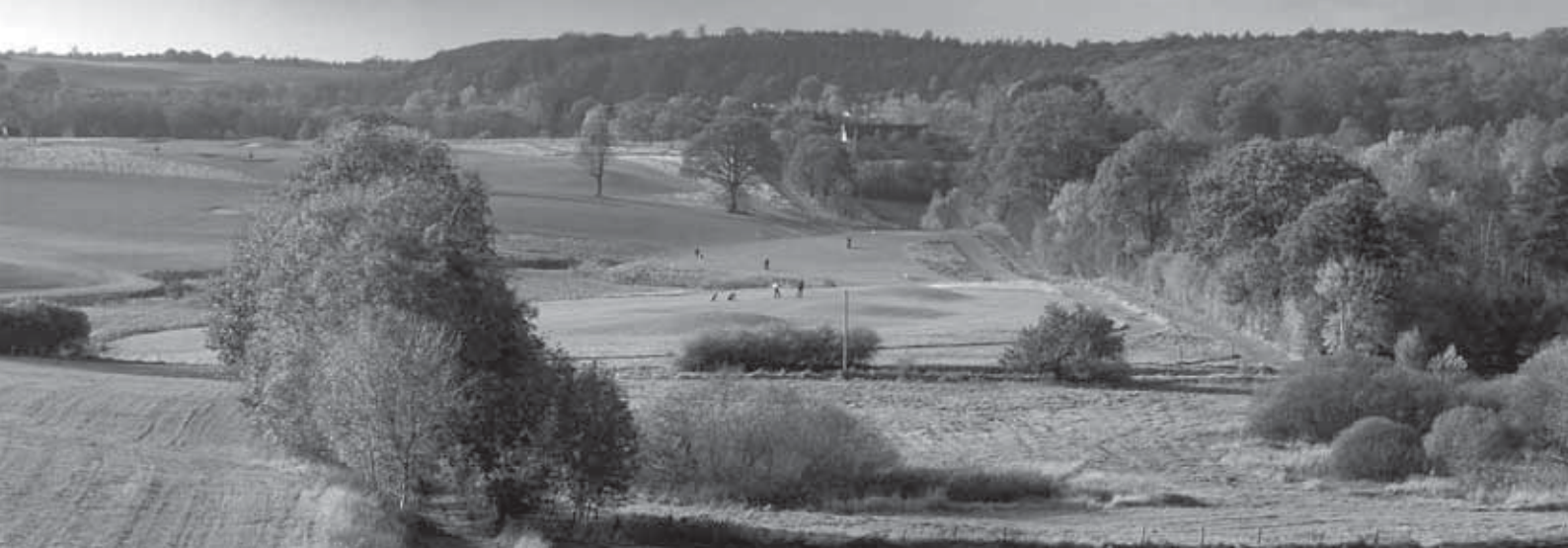
Fra Ryget mod Ganløse Ore.