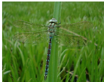
< Grøn mosaikguldmed