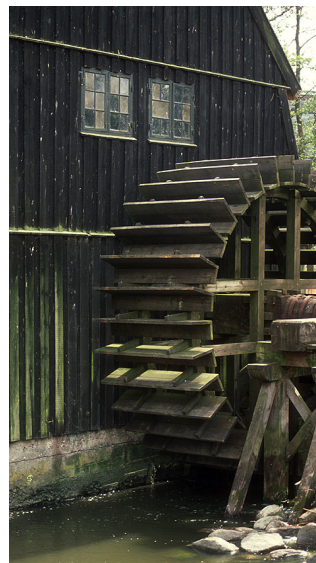
Vandhulet på gavlen ved Lyngby Mølle.

Mølleåen forbinder de 4 store søer; Bastrup Sø, Farum Sø, Furesø og Lyngby Sø. På sin 36 km lange vej til Øresund, har åen et fald på 29 m. Kombineret med en stabil vandføring, har det skabt grundlaget for, at der siden middelalderen har været opført en lang række vandmøller. Møllerne er blevet placeret, hvor terrænet gjorde det naturligt at lave passende opstemninger på åen. I åens nedre løb var vandføringen så stor, at møllerne fra 1600- til 1800-tallet kunne levere energi til nogle af Danmarks tidligste industrivirksomheder.