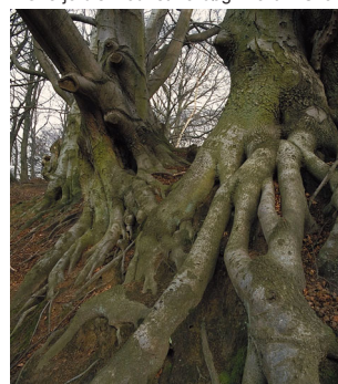
v Overjordisk rodnet fra bøg i Farum Skov

Mange af skovene i området er gamle græsningsskove. Det ses af stednavnene Farum Lillevang, Nyvang og Ganløse Ore. "Vange" var indhegninger til græsning og "øre" er et gammelt ord for græsningsoverdrev. Mange steder kan man se de gamle flerstammede bøge, som har fået deres skæve former af husdyrenes gnav og slid. Flere af skovene er i dag udpeget til naturskov, hvor væltede træer får lov til at ligge til glæde for svampe og insekter.