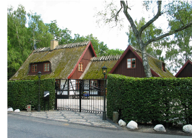
I dag er der privat bolig, hvor den Øvre Hestetangs Mølle i sin tid lå.

Terkelskov har navn efter en møllerfamilie, som havde græsningsret i skoven. Grus- og kalkgravning i Terkelskov har efterladt et kuperet landskab. Kalken blev brændt til mørtel bl.a. til bygning af de kongelige slotte. Kalkgravningen i Terkelskov ophørte i 1869, udkonkurreret af Faxe Kalkbrud. Herefter blev området plantet til med skov. Råstofgravningen har også givet navn til Kalkgården, som indtil 1999 fungerede som et traktørsted.