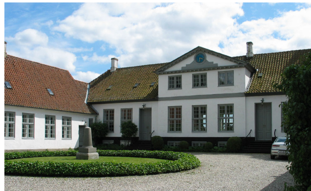
Farumgård er i privat eje. Der er offentlig adgang gennem gården, men kun til fods. Cyklister må følge den afmærkede rute op gennem byen.

En ås ved Gretesholm har dannet et næs ud i Farum Sø. Her ligger jættestuen på Gretesholm ved et af oldtidens vigtige overgangssteder. På bakken overfor jættestuen er der gjort fund af flinteaffald, skræbere, flækker og sløbne tyknakkede økser.