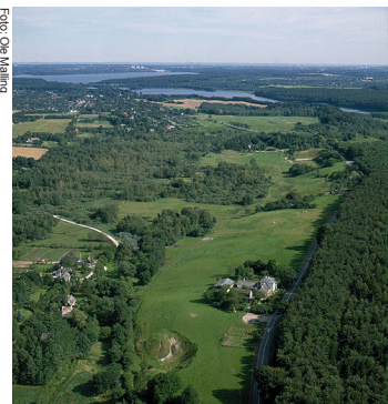
Mølleådalen med Kalkgården nederst til højre og Farum Sø og Furesø i baggrunden.

Mølleådalen er en del af et stort, forgrenet dalsystem mellem Roskilde Fjord og Øresund. Der er forskellige bud på, hvordan dalene kan være dannet. Den ene går på, at det er smeltevandsfloder under istidens gletsjere, som har skåret tunneldale ned i undergrunden. En anden teori går på, at der inden istiden er sket forskydninger i de kalklag, der ligger under jordlagene. Disse forskydninger har så dannet et system af dale, som senere er blevet gennemstrømmet af istidens smeltevand.