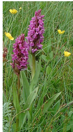
Orkidéen, Maj-Gøgeurt kan opleves i Krogenlund Mose

Mølleådalen fra Buresø til Furesø rummer mange unikke og værdifulde naturtyper, som er gået kraftigt tilbage både i Danmark og i hele Europa. Hele strækningen er derfor udpeget NATURA 2000 område, et værdifuldt naturområde af international betydning. Krogenlund Mose, Klevads Mose og Farum Sortemose, er vigtige levesteder for insekter og fugle og her findes et stort antal sjældne planter, som netop er afhængige af næringsfattig, fugtig og lysåben natur. For at hindre områderne i at gro til i skov medvirker Frederiksborg Amt til opsætning af hegn for græssende kreaturer eller udfører egentlig naturpleje.