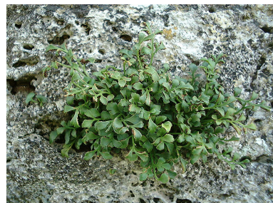
Den meget sjældne plante Murrude kan ses på de lodrette flader af Bastrup Tårn

Mange af skovene i området er gamle græsningsskove. Det ses af stednavnene Farum Lillevang, Nyvang og Ganløse Ore. "Vange" var indhegninger til græsning og "øre" er et gammelt ord for græsningsoverdrev. Mange steder kan man se de gamle flerstammede bøge, som har fået deres skæve former af husdyrenes gnav og slid. Flere af skovene er i dag udpeget til naturskov, hvor væltede træer får lov til at ligge til glæde for svampe og insekter.